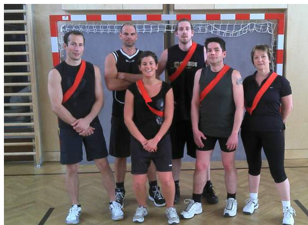
Platz 1: Lehrer

Bei unserem schon traditionsreichen Basketballturnier kämpften 2011 leider nur 3 Teams um den Meisterschaftstitel. Nichtsdestotrotz wurde hart gekämpft und fair gespielt. Nach dem letzten Sieg der Lehrer konnte auch 2011 niemand das Team der Lehrer aufhalten. Der Platz zwei ging an das Team Legenden , und der dritte Platz an das Team MEDBB .