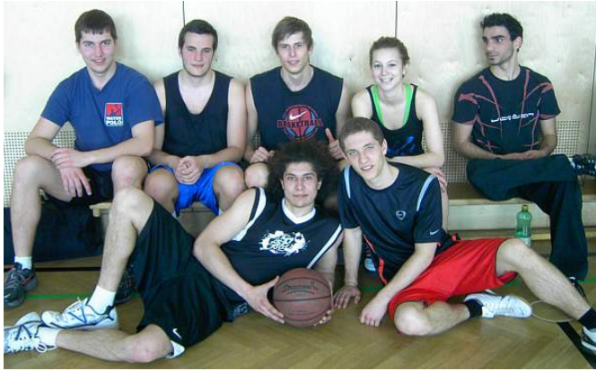
Platz 2: Legenden