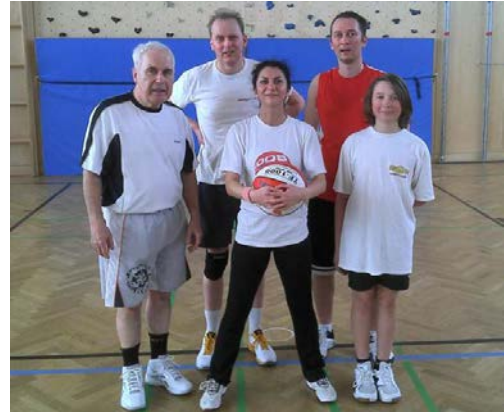
Platz 3: MEDBB